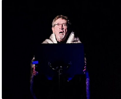
C'est mon ami qui me l'a dit !