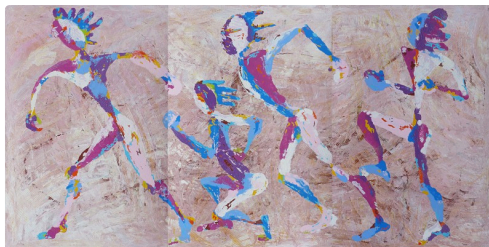
Triptyques " Coureurs"