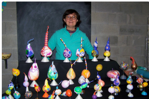
Les coloquintes n'ont plus de secret pour elle