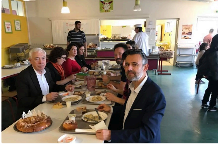
La galette des rois au groupe scolaire