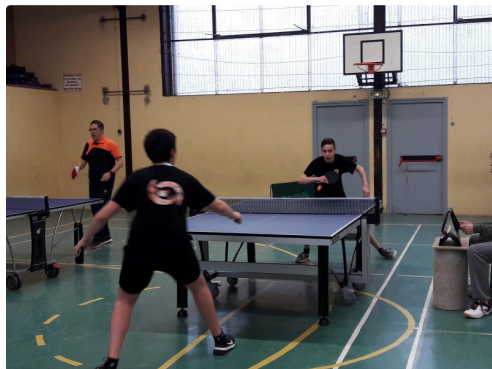
photo d'un jeune de l'équipe 5

Prochaine journée de championnat dans 15 jours. Toutes les équipes évolueront dans la salle polyvalente. Samedi 27 janvier critérium individuel à Auch.