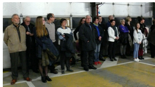
Les maires d'Auch, Lahitte, Montaut les Créneaux, Ordan-Larroque, Preignan, Castin, Duran et Tourrenquets étaient présents à la cérémonie.