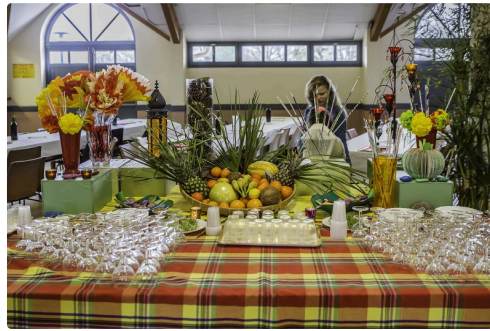
La somptueuse table de l'apéritif préparée par Les Papillons jaunes