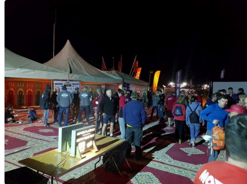
le bivouac (photo entourage du pilote)