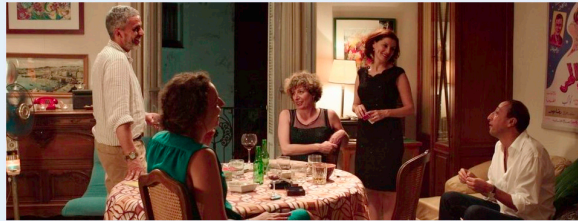
Début d'année avec les HalluCinés

La junior association du lycée d'Artagnan propose à tous d'assister à la projection de 3 films que ses membres ont sélectionnés. Voici l'opinion des HalluCinés sur ces films.