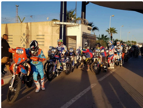
prêts à l'embarquement