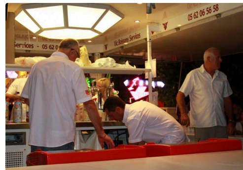
la buvette en action pour vous servir