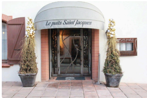
l'entrée du puits Saint-Jacques