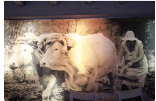
une certaine ruralité dans le vestibule