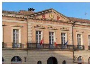
Mairie de l'Isle-Jourdain.