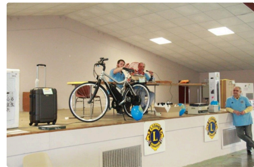
une partie des loto