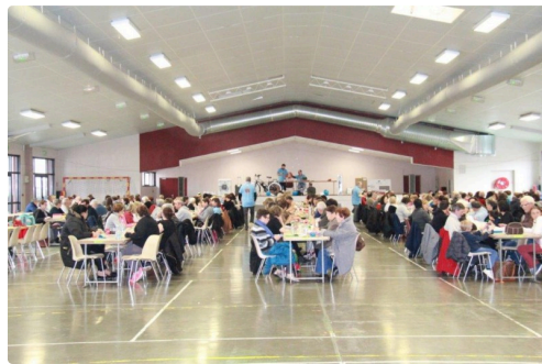
les joueurs de loto