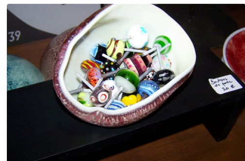
Des boutons de porte en verre, aux belles couleurs vives, d'Agnès Busnel