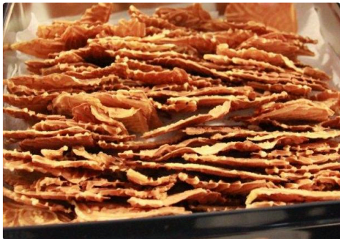
gâteaux au fer