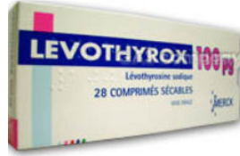
LEVOTHYROX : Eléments complémentaires