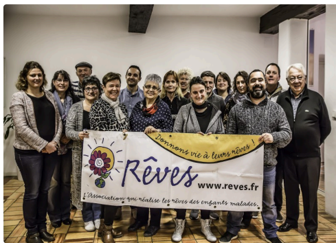
Tous ensemble, artisans taxis et membres de Rêves