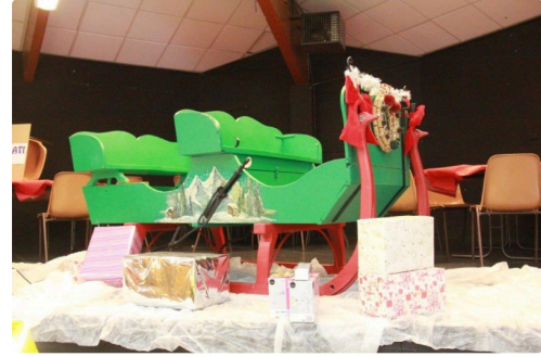
le traîneau du Père Noël