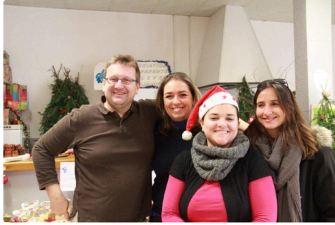
le stand de l'association de parents d'élèves