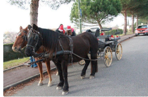
promenade en calèche