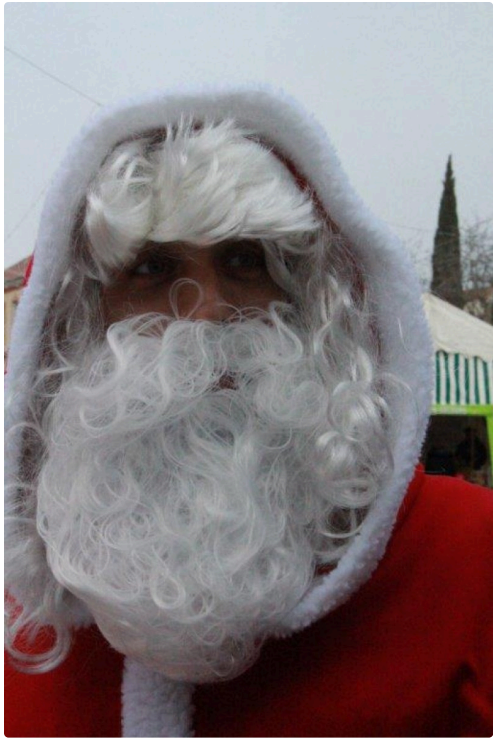
le Père Noël