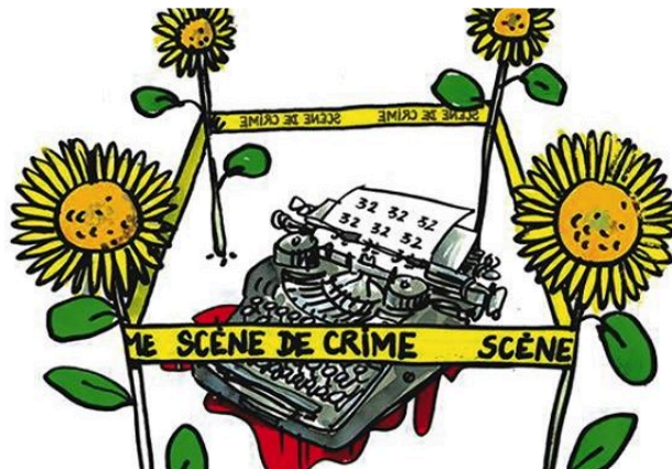
"Festival Polars et histoires de police"