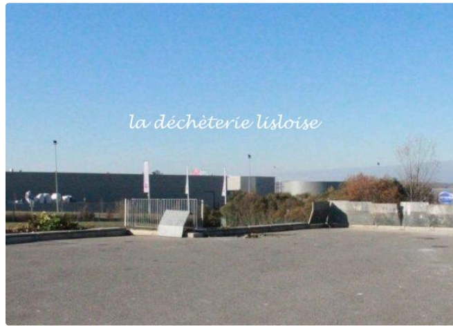
Un macaron pour accéder aux déchèteries du Sictom Est