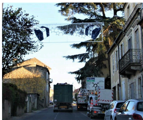
Des installations parfois périlleuses...