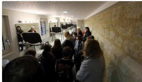
Le public attentif