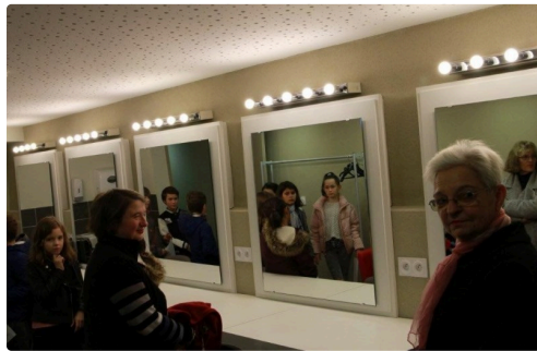
Découverte des loges