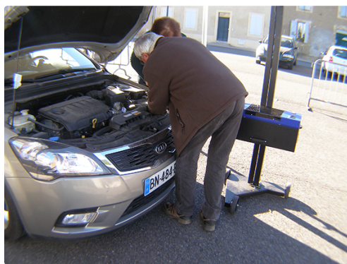
P1010005 phares (2).jpg

.La nuit, on enregistre moins de 10 % du trafic journalier, mais 45 % des accidents mortels. Pour bien voir et être vu, il faut contrôler régulièrement ses phares : vérifier les ampoules, régler leur hauteur pour ne pas éblouir les autres usagers et nettoyer les optiques pour ne pas perdre de la luminosité. Clignotants, feux de détresse... bien utiliser ses lumières est un véritable atout pour la sécurité.