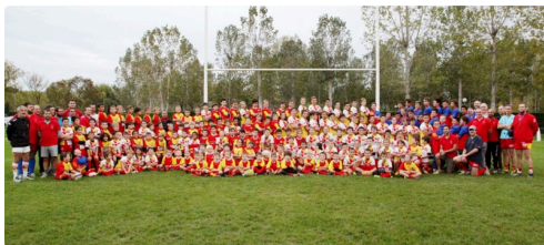
l'ensemble des jeunes du club