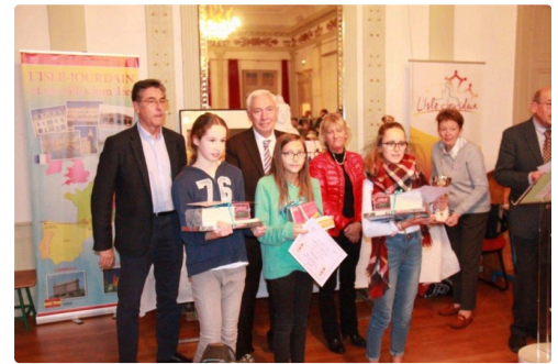
Les promues collège