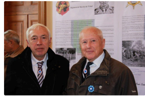
Le Maire et le Président