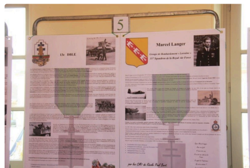
Divers panneaux d'hommage