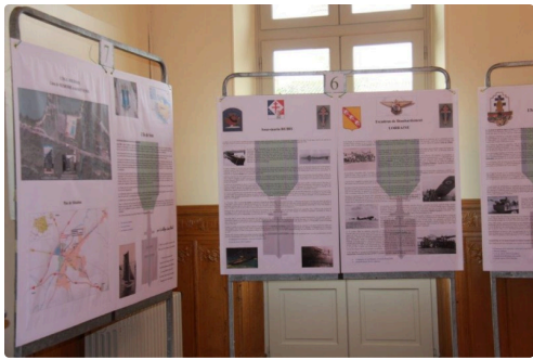
Autres panneaux d'hommage