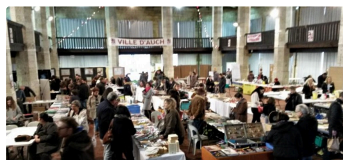
Les amateurs à la recherche de leur bonheur