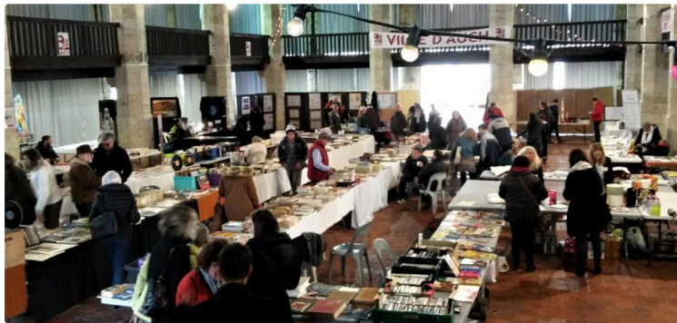
Auch - Première pour le Salon du Livre

Les amateurs de livres et bandes dessinées ont bravé le mauvais temps de ce week-end pour aller chiner du côté de la Maison de Gascogne, où se tenait le 1er salon du livre organisé par l'Amicale des Anciens de Pardailhan, en partenariat avec Philajeune.