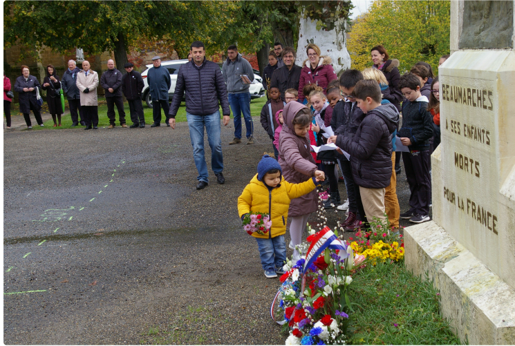
Square des Anciens-Combattants

Un lieu de mémoire inauguré à Beaumarchès