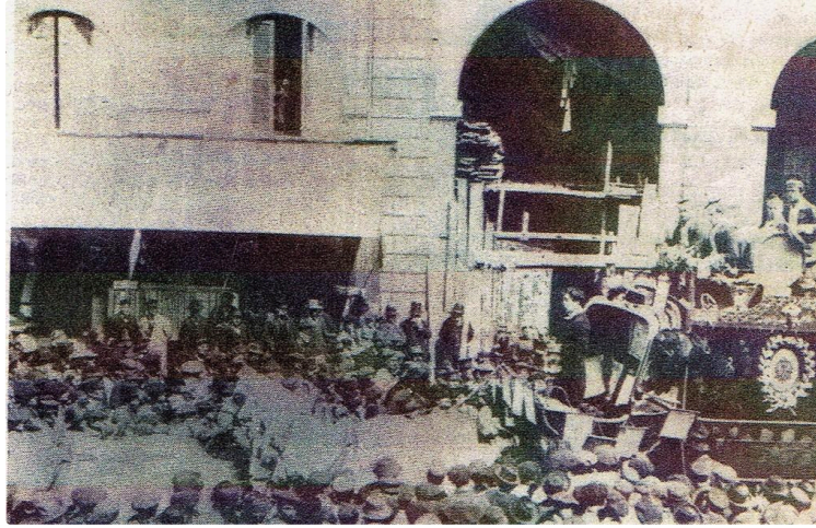
La Bartherote : arracheuse de dents ambulante