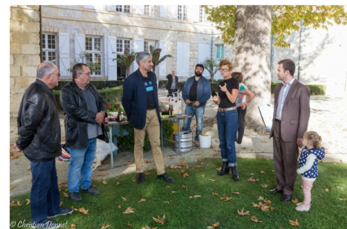
festival bizarre 2017 -40.jpg