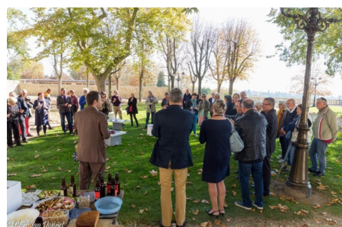
festival bizarre 2017 -50 (2).jpg