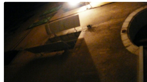
L'étage de l'immeuble.