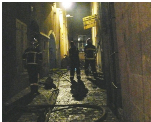
L'impasse Dessoles est une rue étroite et difficile d'accès pour les secours.

Etaient sur place la police, les services ENEDIS pour l'électricité et GRDF pour le gaz ont sécurisé les réseaux.