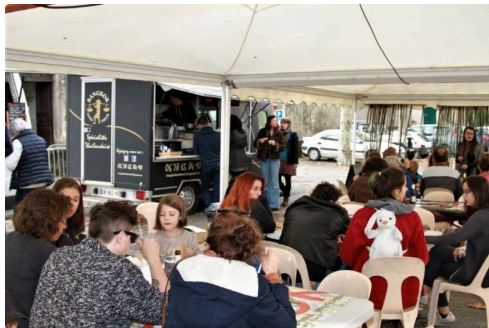
Le coin restauration