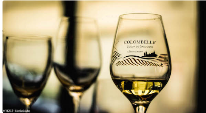
AUCH ; La Colombelle 2017 est arrivée

La Colombelle 2017 est arrivée, une merveille.