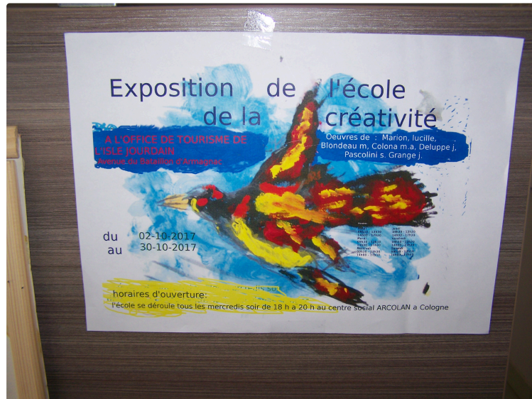
Exposition de l'école de la créativité à l'Office de Tourisme de la Gascogne Toulousaine à l'Isle-Jourdain