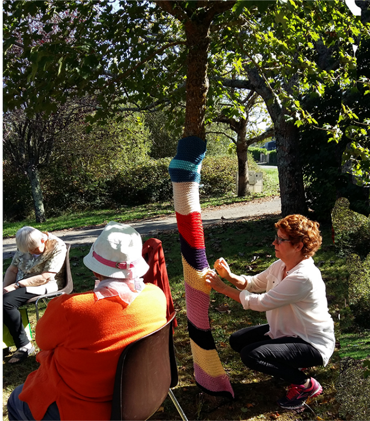
Le yarn bombing vous connaissez ?

Passez par Saint Martin pour le découvrir