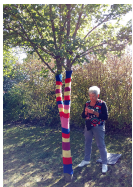
St Martin prend des couleurs !!!

les arbres s'habillent de belles couleurs ! bizarre ,mais que se passe t'il donc a St Martin? le vingtième salon d'art !! bien sur !!