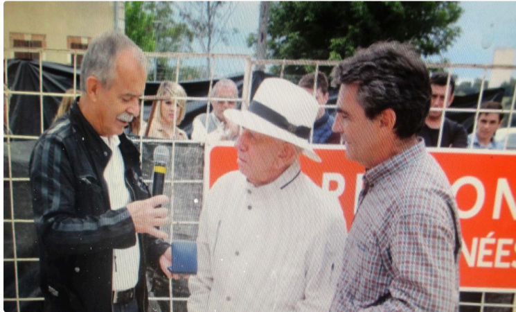
Hommage à Victorino