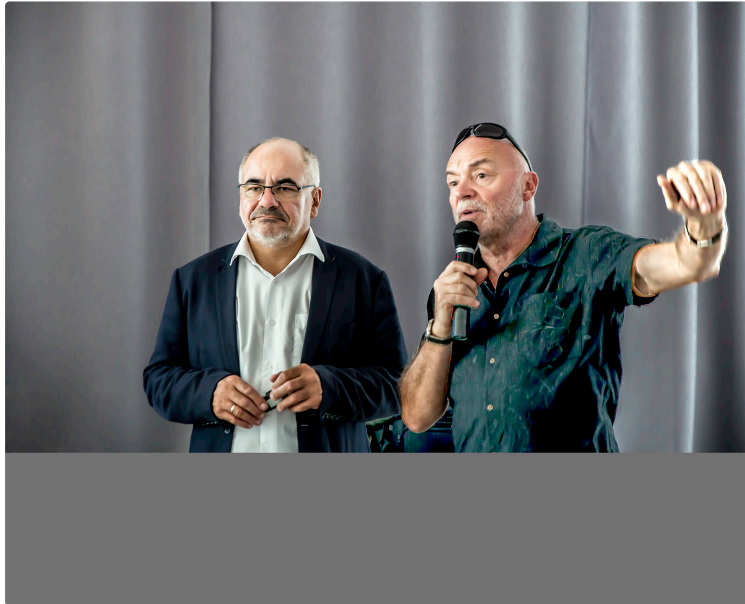
Nogaro – Enedis informe les élus

Le 3 octobre, Enedis invite les élus de l'ouest du Gers à sa réunion annuelle d'information. Qui vient après celles de Gimont et Auch et avant la dernière, celle de Saint-Médard. Comme chaque année, il s'agit pour Enedis (ancien nom d'Électricité réseaux distribution France) d'exposer aux élus des collectivités locales les activités et l'évolution de l'entreprise de distribution d'électricité et les services qu'elle peut leur rendre.