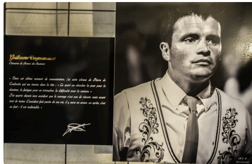
Guillaume Vergonzanne, champion de France des sauteurs 2011 et 2015