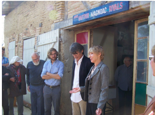
Présentation des trois artistes

L'exposition est découverte au lieu dit « Le Soulès » près de Samatan, jusqu'au 8 octobre