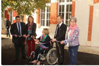
L'école retrouve une seconde jeunesse après d'importants travaux