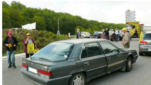
le rond point de La Huré.