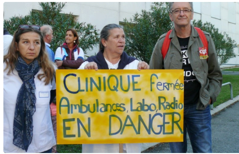
Tout est dit.