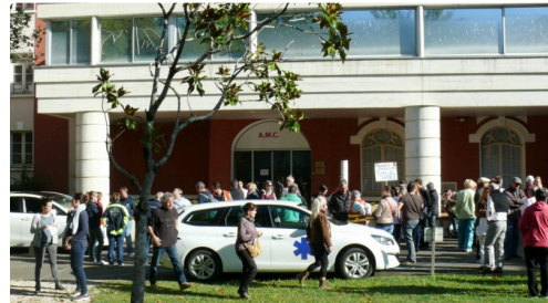
Les salariés et les ambulances arrivent ..

Une épée de Damoclès est suspendue au-dessus de ces salariés de la polyclinique lesquels « sont plongés dans une grande angoisse et incertitude sur leur devenir », résumant les représentants syndicaux.