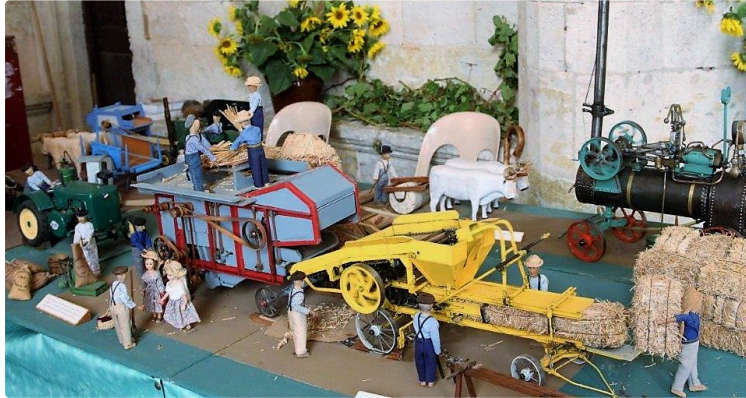
Condom - L'expo à remonter le temps