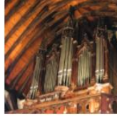
Les amis des orgues