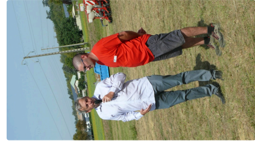
Le député Jean-René Cazeneuve au côté du président des JA, Benjamin Constant.