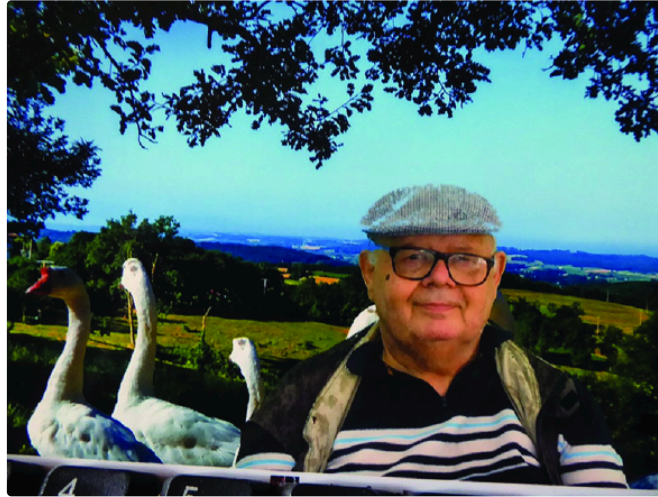
Paris : Gers sur bord de Seine

Les Marchés Flottants du Sud-Ouest retournent à Paris du 15 au 17 Septembre.