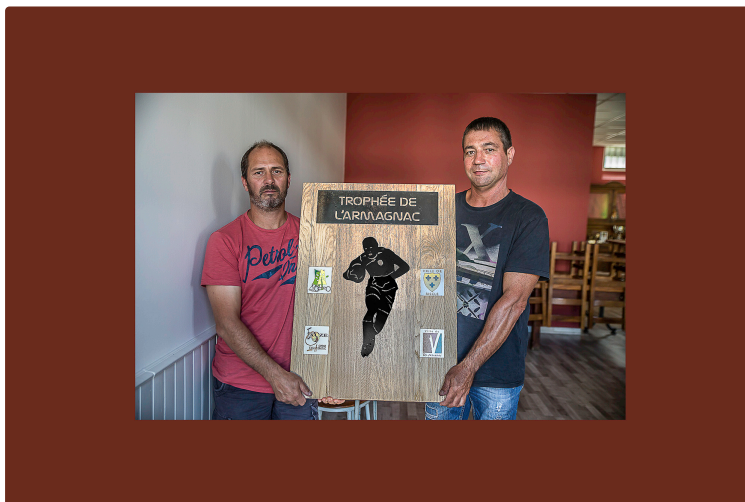
Nogaro – Une belle journée de rugby

Pour le Trophée de l'Armagnac le 2 septembre