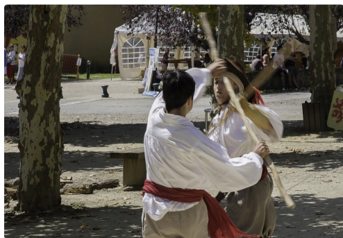
Suite du duel au bâton