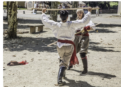
Duel au bâton