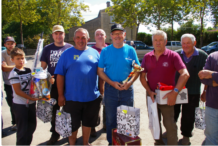
Concours de pêche "Roger Renaud " de la fête

Vingt et un pêcheurs dont un enfant au rendez vous