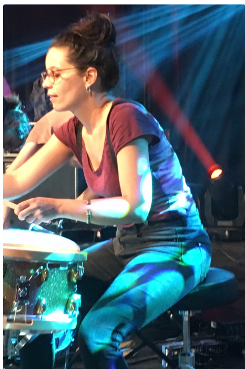
Pendant le soundcheck